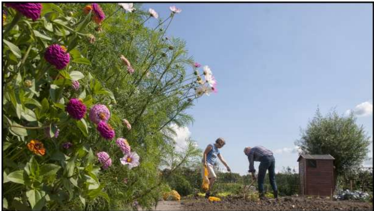
Herinnering aan een mooie zomer